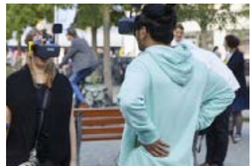
Agentur des städtischen Wandels, Braubachstrasse Aktionstag Post-Corona-Innenstadt Frankfurt