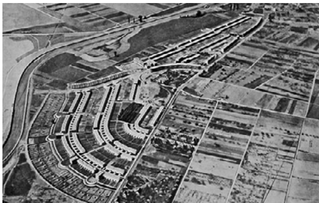
Abb.: Historisches Luftbild der Siedlung Frankfurt-Römerstadt, ca. 1930

Neben Beiträgen aus Architekturgeschichte und Denkmalpflege, wird die Veranstaltung auch mit Positionen aus Kunst, Film und Musik vertieft sowie durch studentische Arbeiten ergänzt.