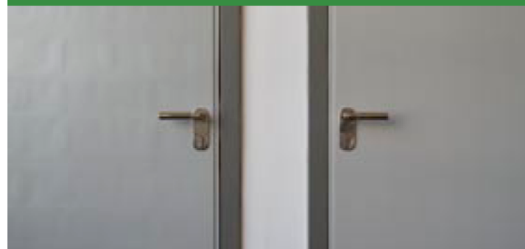
Türen im Bauhaus Dessau, 2006, Türdrücker und -schilder: Entwurf Walter Gropius

Wir freuen uns über neue Mitglieder und jede Art der Unterstützung.