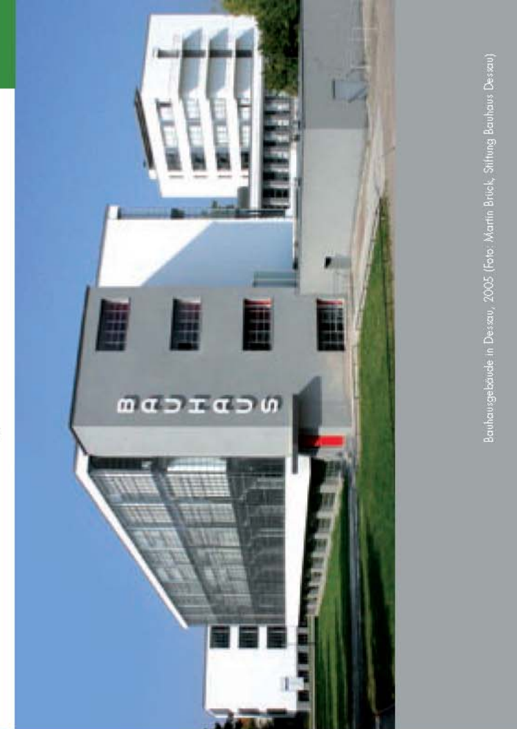
Bauhauptgebäude in Dessau, 2005