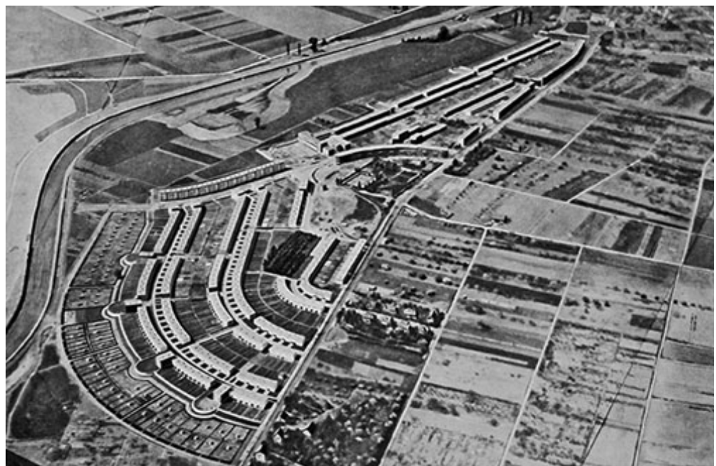
Abb.: Historisches Luftbild der Siedlung Frankfurt-Römerstadt, ca. 1930

Neben Beiträgen aus Architekturgeschichte und Denkmalpflege, wird die Veranstaltung auch mit Positionen aus Kunst, Film und Musik vertieft sowie durch studentische Arbeiten ergänzt.