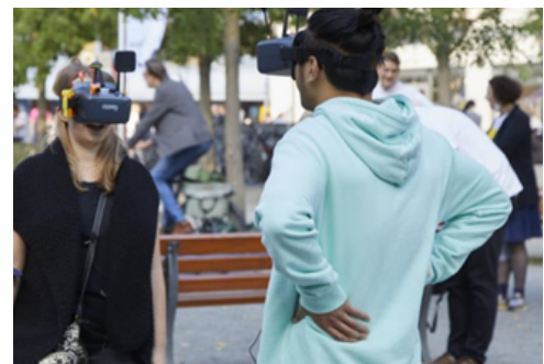
Agentur des städtischen Wandels, Braubachstrasse Aktionstag Post-Corona-Innenstadt Frankfurt