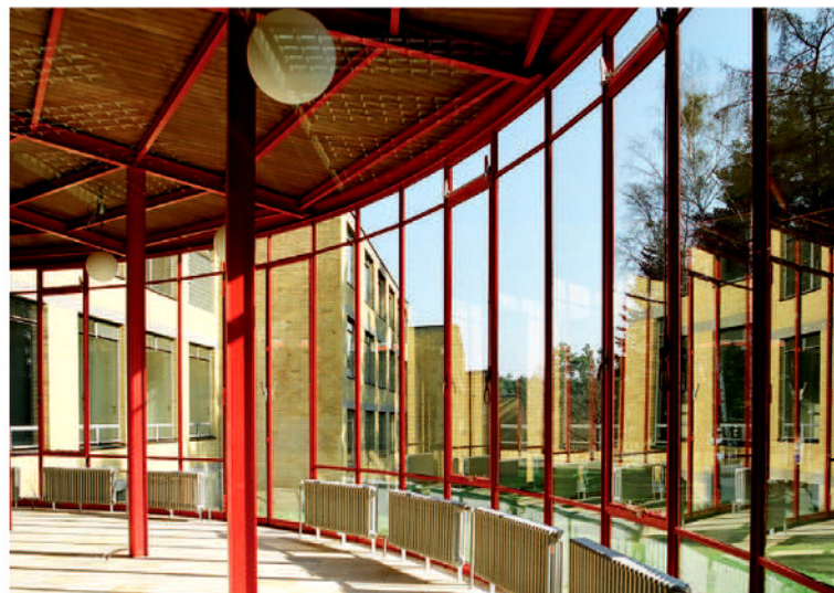
Wintergarten, ehem. Bundesschule des ADGB in Bernau, 2006