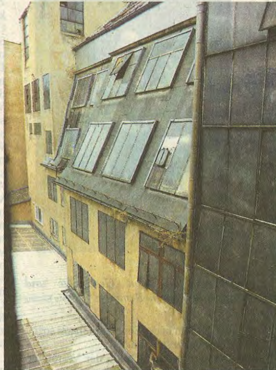
Nicht nur für Autofreunde: Das Tempo der Zeit ließ sich an den Fassaden der Kant-Garagen in Berlin stets ablesen.

„Tempo der Zeit“, von dem alle Welt schwärmte und als dessen Inbegriff das Auto galt, seinen bildhaften Ausdruck. Also machten die Kant-Garagen Sensation; 1932 im Rahmen der Internationalen Bauausstellung, wurden wegen der großen Nachfrage Führungen durch das Gebäude angeboten.