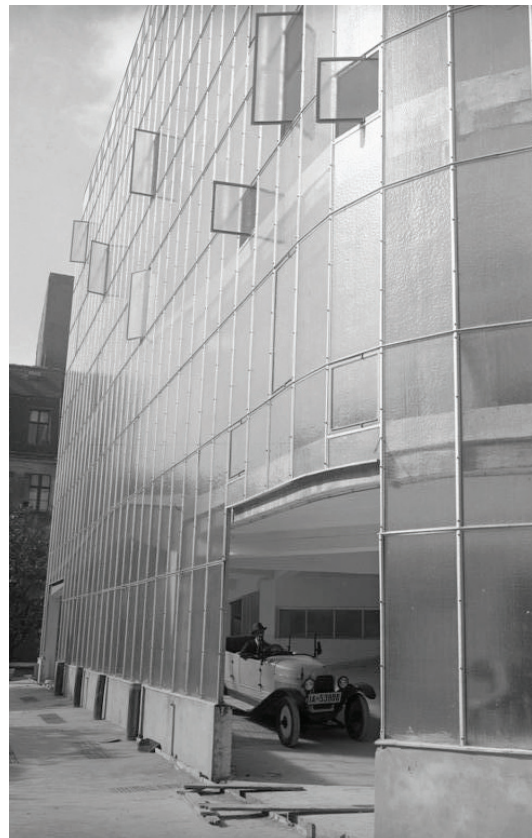
Rückseite Kant-Garagen-Palast 1930