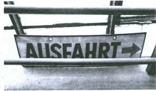
Ausweg gesucht. Einst war die Ausfahrt klar, jetzt wird heftig um die Zukunft des denkmalgeschützten Gebäudes gerungen.