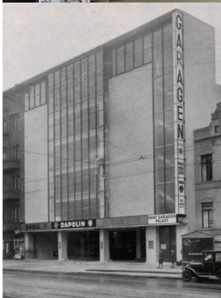
Kant-Garagen-Palast 1932 © In: Die Form, 8/1932