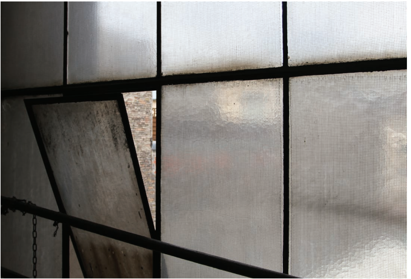
Kant-Garagen-Palast 2013