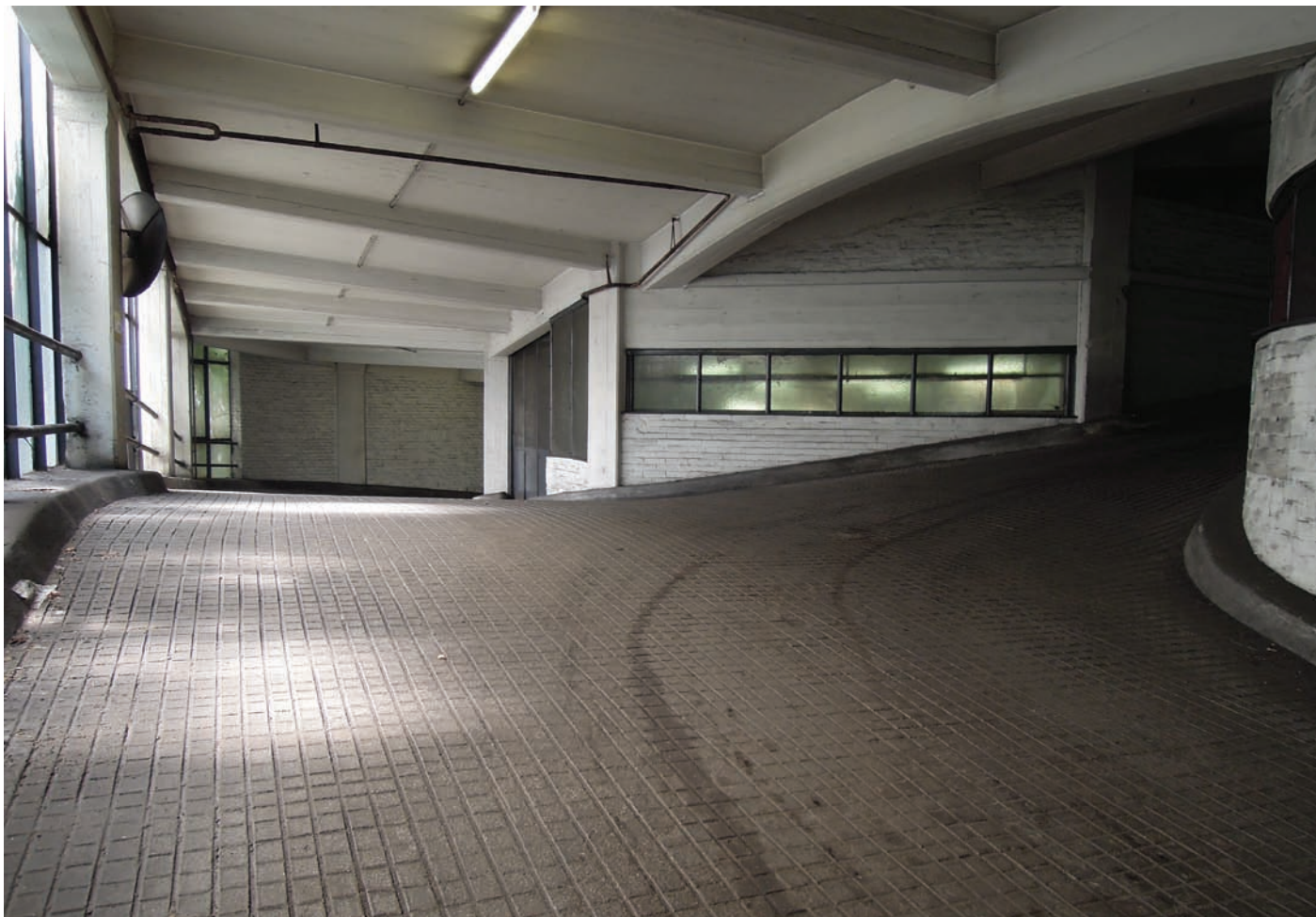
Kant-Garagen-Palast 2013 © Thomas Steigenberger