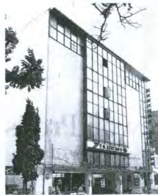
Gebäude mit Geschichte. Die Kant-Garagen wurden 1929 bis 1930 gebaut.

Das Gebäude könnte auch noch zehn oder 20 Jahre überleben, trotz der Nässe und der Kälte im Winter, glauben die Mechaniker. Die Kantstraße in der Umgebung, das waren früher viele Bombenbrachen, ein nicht ganz koscherer Kiez mit Prostituierten und Zuhältern, erinnern sich die Garagenmieter. Die blicklichten